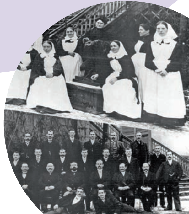
Diakonissen und Wächter – 1906

Seit über 145 Jahren im Einsatz für hilfsbedürftige Menschen